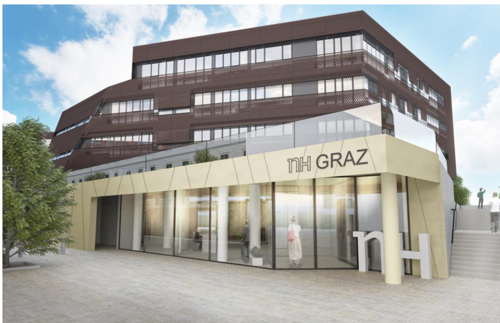
Am Karmeliterplatz 4 entsteht das NH Graz, das 2018 eröffnen soll – Sicht vom Pfauengarten.