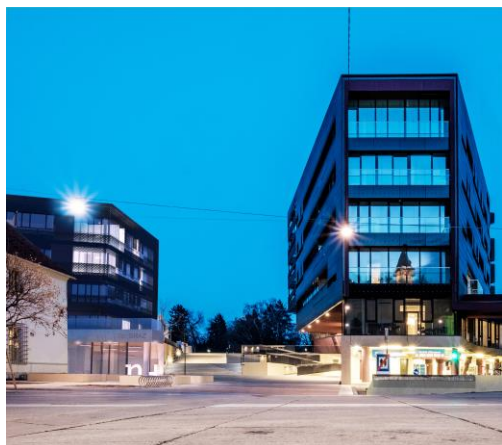
Sicht auf das NH Graz vom Karmeliterplatz.